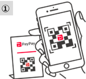
① お客様がスマートフォンで お店のバーコードを読み取る