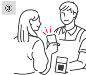
③ お店のスタッフか 画面を確認してお会計が完了