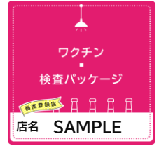
登録店ステッカー